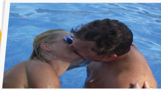
L'amour est dans l'eau